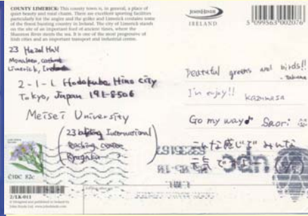
リムリック留学中の学生から、国際教育センターに絵葉書をもらいました！