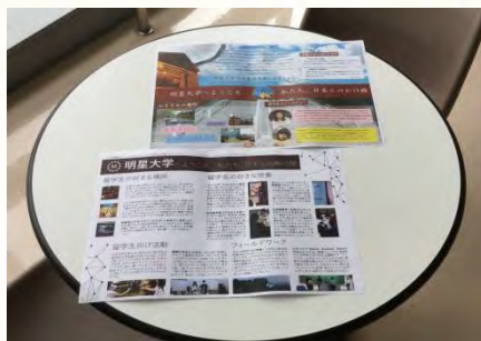
↑パンフレット完成♪