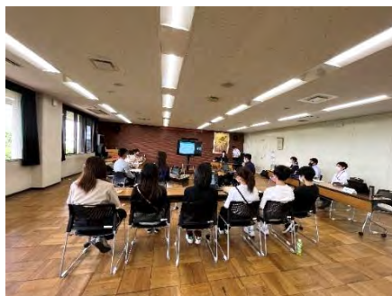
日野市役所での高大生のための オンライン見学会の様子