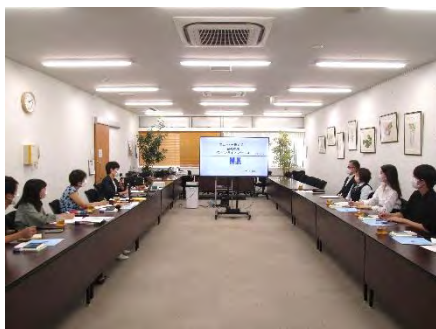
オーダーメイド型の働き方で 100年企業を目指す エム・ケー株式

長島ゼミ・明治大学奥山ゼミと協働で実施）では、WLB調査に協力していただいた日野市役所と、エム・ケー株式会社の2社でオンライン説明会を実施することができました。参加した皆さんには、社会人として働く上で、WLBの大切さについても感じ取ってもらうことができ、有意義な調査となりました。