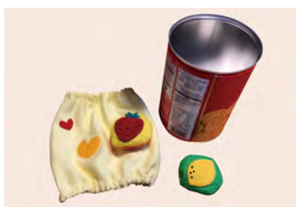
図4 手作りおもちゃ箱のカバーを外したイメージ