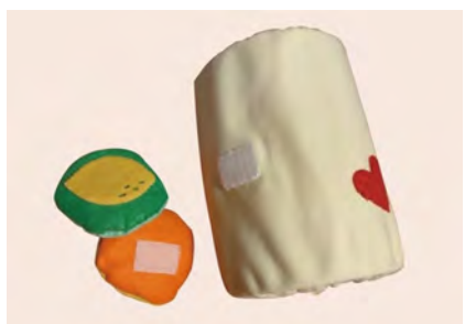
図5 缶にカバーを取り付ける手作りおもちゃ箱

異なるおもちゃ箱2種を用いて、1～2歳児2名の幼児を対象におもちゃ箱の違いによる片付け行動の変化を調査した。2021年11月11日、11月12日の2日間、異なる時間帯でそれぞれの観察を行った。遊んだおもちゃはいずれの日も、木製のおもちゃ、ぬいぐるみであった。