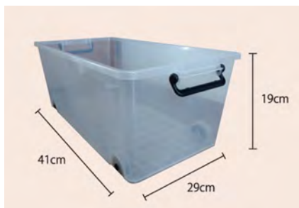
図3 通常使用するプラスチック製のおもちゃ箱

そこで、おもちゃ箱に着目した片付け時の幼児の行動や表情の変化について調査することとした。おもちゃ箱は、通常使用しているプラスチック製のおもちゃ箱（図3）および、手作りのおもちゃ箱（図4）を使用する。手作りのおもちゃ箱は、非常食や離乳食などの空き缶を使用し、ぬいぐるみを取り付けたカバーを被せておもちゃ箱自体をおもちゃのように見せたものである。