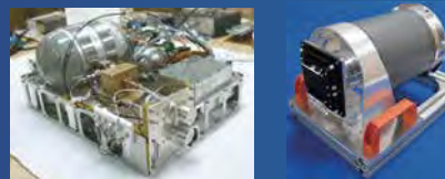
開発したイオン推進器(左)と6mGSD光学カメラ(右)