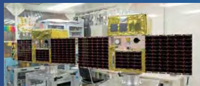
ほどよし3号(左)と4号のフライトモデル

本プロジェクトは、様々な側面で非常に大きなインパクトを与えた。多くのベンチャー企業の創設等に繋がっただけでなく、海外展開を見据えた普及・啓発にも注力した。人工衛星産業への参入の敷居を下げた。「宇宙空間貸しスペース」という発想が面白い。