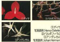
①ディサ ②パルポフィラム ③アングレカム

ふしぎなアフリカの蘭たち：主催者特別展示はアフリカの神秘的な蘭を集めました。華やかな色彩で神々の花と言われる「ディサ」、動く「パルポフィラム」、ダーウィンの進化論で注目を集めた「アングレカム」などアフリカの蘭で楽園を表現し展示します。