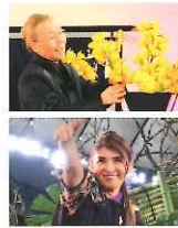
假屋崎 省吾氏 志穂美 悦子氏

華道家・假屋崎省吾氏と女優・志穂美悦子氏が今回も世界らん展に登場。大胆な展示と豪華なステージを展開します。