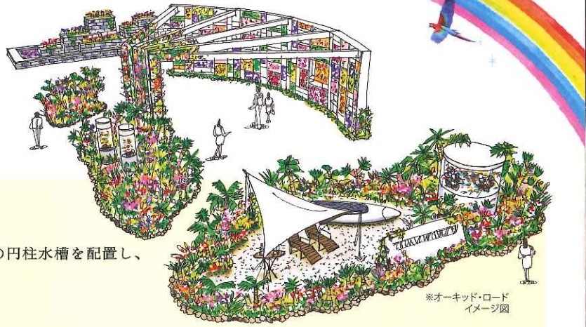
※オーキッド・ロード イメージ図